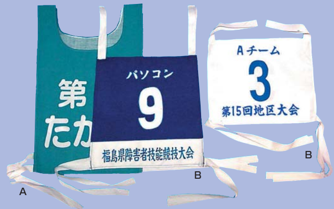
〈別注ゼッケン価格表〉(番号入り・1色プリント) (1組単価)