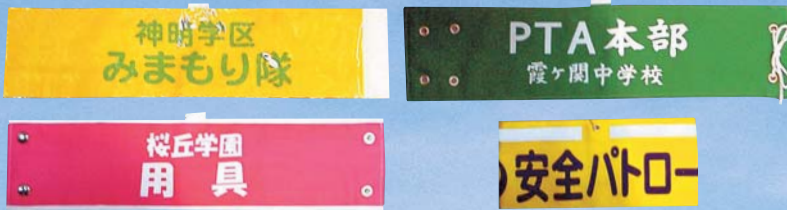
〈別注腕章価格表〉(9×38cm・ハトメ加工) (1本単価)